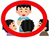
友達のことを大切に聞く