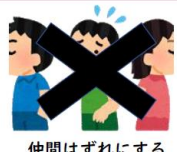
仲間はずれにする