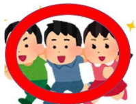
お友達と仲良く遊ぶ