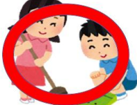
お友達と協力する